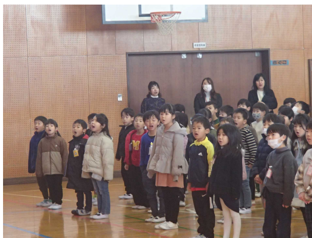
元気いっぱいの校歌

始業式では、能登半島地震や航空機事故にふれ、みんなが幸せな1年になりますようにと呼びかけました。また、3学期はまとめの学期であるとともに、感謝の学期であることを子どもたちに伝え、みんなががんばろうと呼びかけました。最後に歌った校歌は、心を込めて元気な声で歌うことができ、子どもたちのがんばろうという気持ちが伝わってきました。